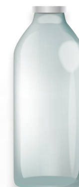
Bocaux / bouteilles