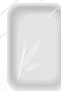
Barquettes / opercules